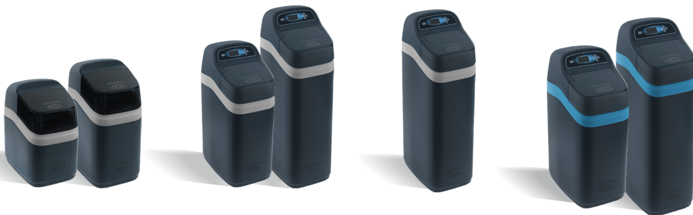
COMPACT 100 & 200

Grâce à la technologie intelligente et brevetée EcoWater®, vous disposerez de la solution la plus économique du marché, tant en termes d'efficacité du sel que de consommation d'eau : jusqu'à 65 % de coûts d'exploitation en moins par an par rapport aux adoucisseurs traditionnels. Votre investissement sera rentabilisé en peu de temps, tandis que vous profiterez chaque jour du confort d'une eau douce.